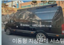
이동형 지상관제 시스템

4차 산업혁명 시대 항공 전문 인재 양성을 위한 통합형 항공 교육 플랫폼