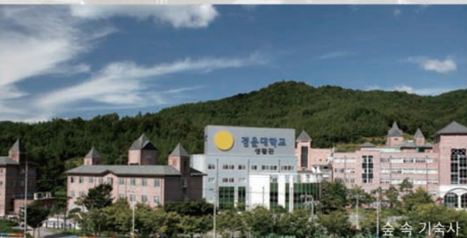
숲 속 기숙사